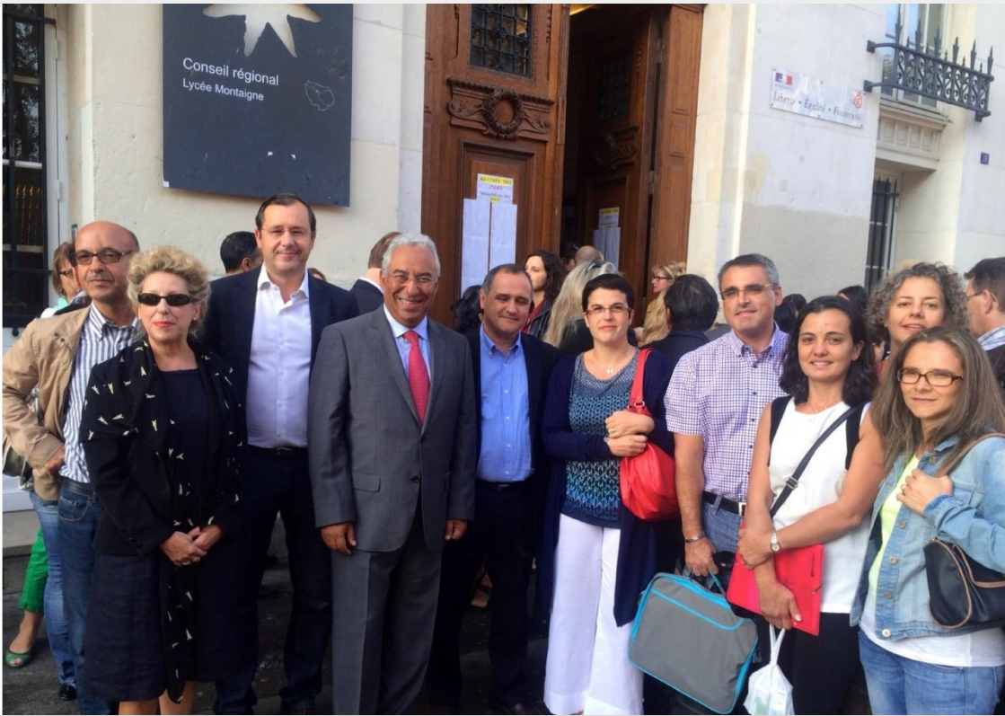
António Costa, 2014, Maire de Lisbonne à l'époque et actuel 1 er Ministre