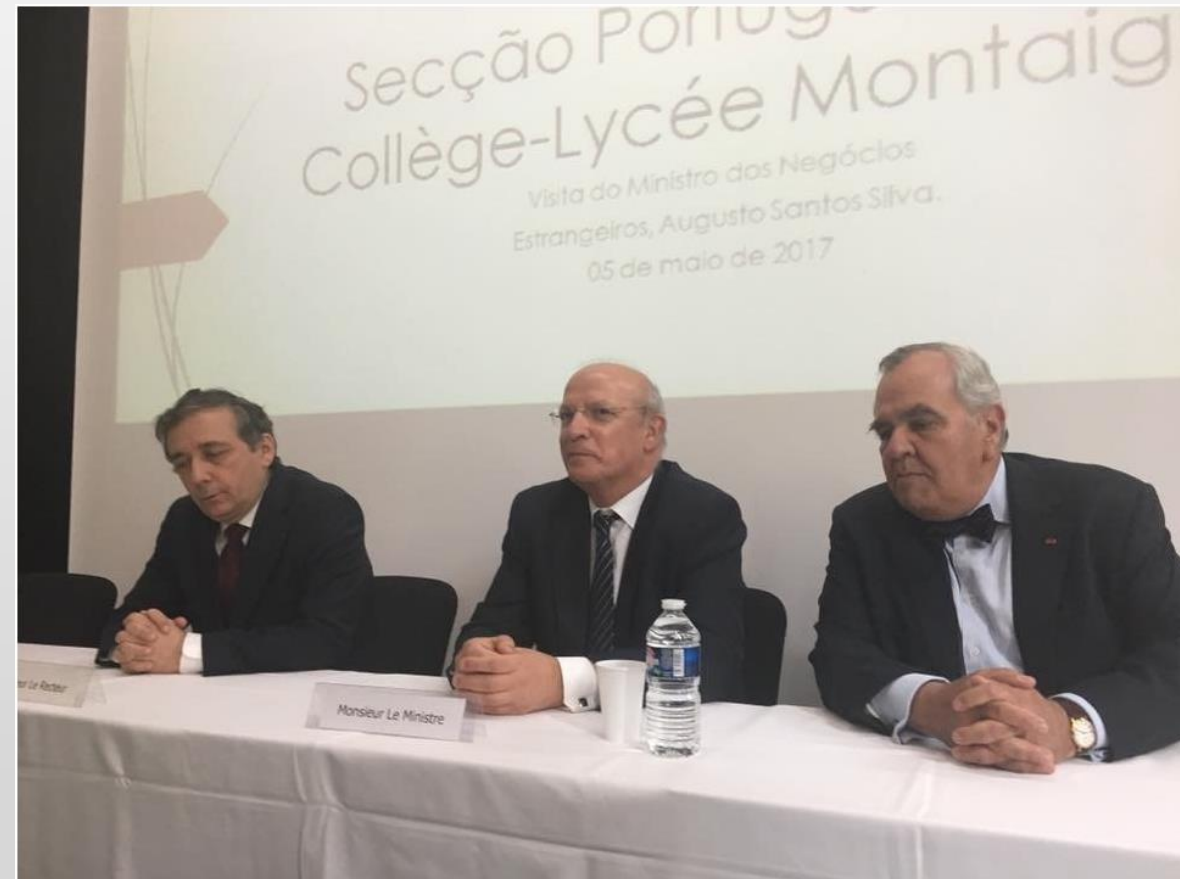
Le Ministre des Affaires Etrangères portugais, Augusto Santos Silva, 2017