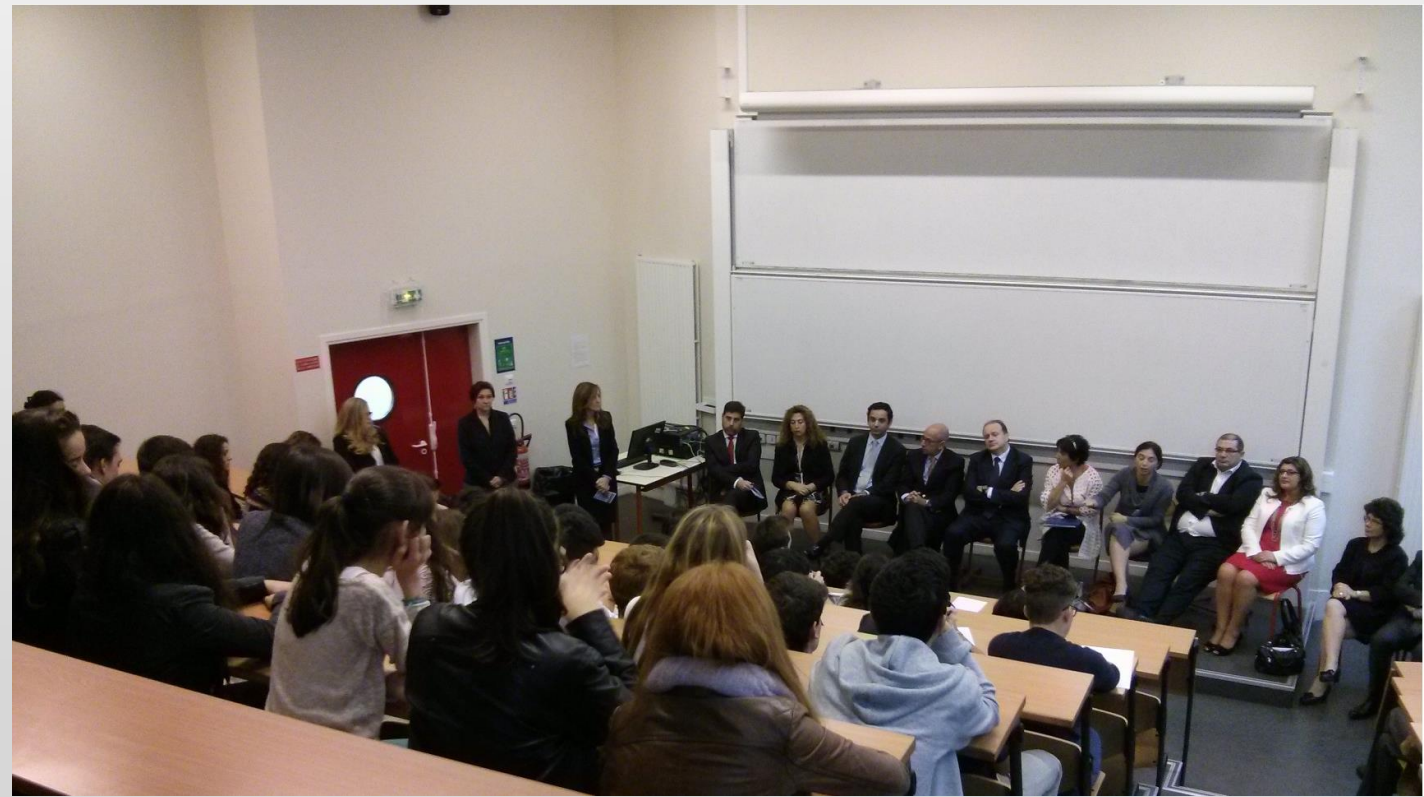
Groupe franco-portugais de députés en 2015